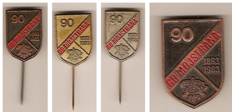
Značke izdelane ob 90 – letnici delovanja društva, leta 1983