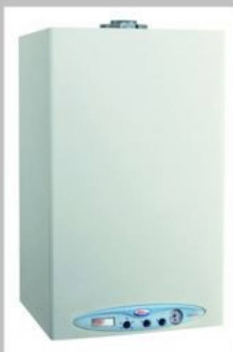
Plinske peči in bojlerji