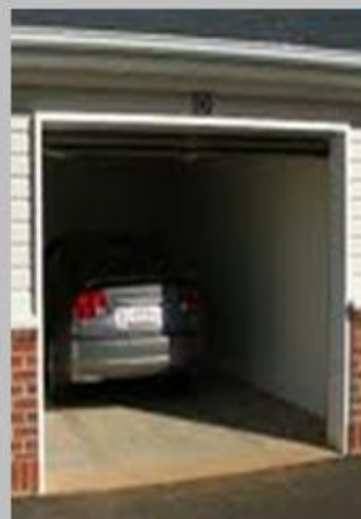
Motorji z notranjim zgorevanjem

V prostoru pride v največ primerih do nastanka prevelikih koncentracij CO zaradi: slabega odvajanja zgorevalnih produktov (neočiščeni ali slabo očiščeni dimniki), napačno izvedenih ali poškodovanih dimniških tuljav (tuljave so počene ali zaradi napake pri izvedbi ali vzdrževanju puščajo dimne pline), neustreznega prezračevanja oz. oskrbe s svežim zrakom v prostor, kjer se nahaja peč na trdno, tekoče ali plinasto gorivo ali plinski bojler (oskrba kurilnih naprav z zgorevalnim zrakom). Do neustreznega prezračevanja pride lahko zaradi napak pri načrtovanju ali izvedbi prezračevanja v prostorih oz. naknadnega posega v prostor (zamenjava oken in vrat z novimi okni in vrati, ki običajno tesnijo boljše od starih), uporabe strojev in naprav, ki jih poganjajo motorji z notranjim zgorevanjem (motorne črpalke, motorne žage, agregati ipd.) v zaprtem prostoru.