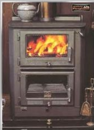
Peči na trdna goriva, naftne derivate (kurilno olje, bencin, petrolej)